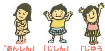
「あんしん」 「じしん」 「じゆう」