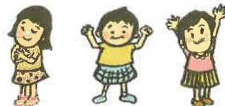
「あんしん」 「じしん」 「じゆう」